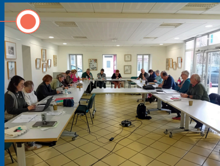
Rencontres des responsables et trésoriers d'équipes du Lot et Garonne et de Dordogne.