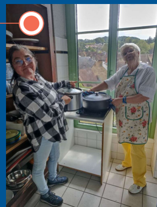
Semaine Laudato Si - Animation à Sarlat sur le Guatemala.