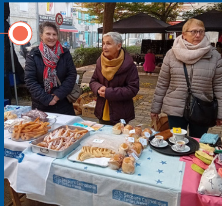
Marché de Noël à Aiguillon.