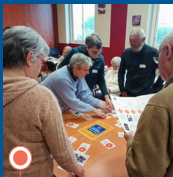
Semaine des rencontres pour agir.