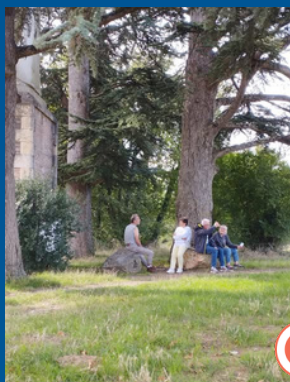
Journées spirituelles à Château Lévêque et à Bon Rencontre.