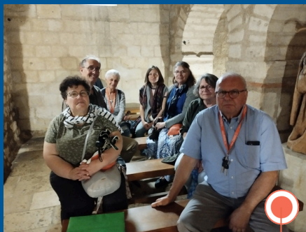
Séminaire du Conseil de délégation à Monflanquin.