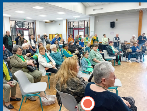
Semaine Laudato Si - Journée de délégation à Monbazillac.