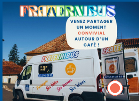
Arrivée du Fraternibus à Castillonnes.