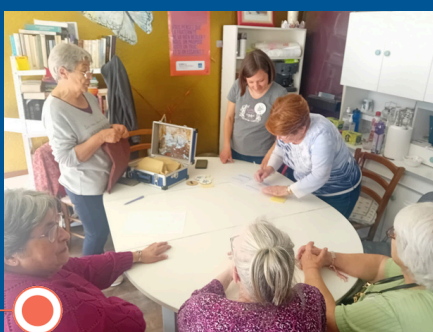
Rencontre des équipes de Marmande, Aiguillon, Tonneins, Clairac autour de la thématique de l'accès digne à une alimentation de qualité.