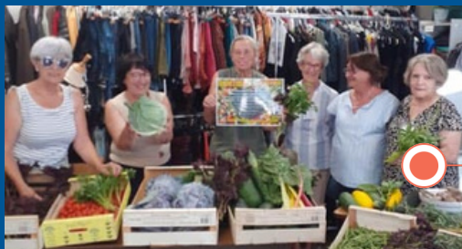
Confection de colis solidaires à Terrasson.