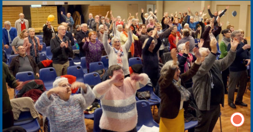
Temps d'échange interculturel organisé par l'équipe locale de Miramont et l'équipe d'animation de la Solidarité Internationale