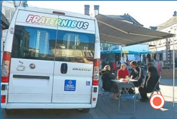
Lancement de l'équipe mobile « Fraternibus » pour aller vers les habitants vivant en milieu rural et lutter contre l'isolement en Dordogne