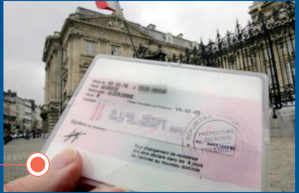
Contribution de la délégation au plaidoyer national sur les taxes sur les titres de séjour des étrangers débouchant sur une baisse de 30 % des montants exigés