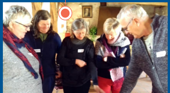
Journée « Être acteur au Secours Catholique » au Fleix pour découvrir notre association et réfléchir au sens de son engagement