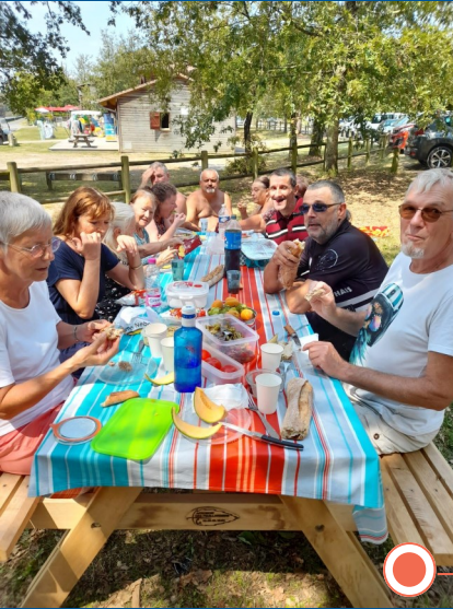
Pique-nique du groupe Convivialité de Bergerac à l'étang de la Jemaye.