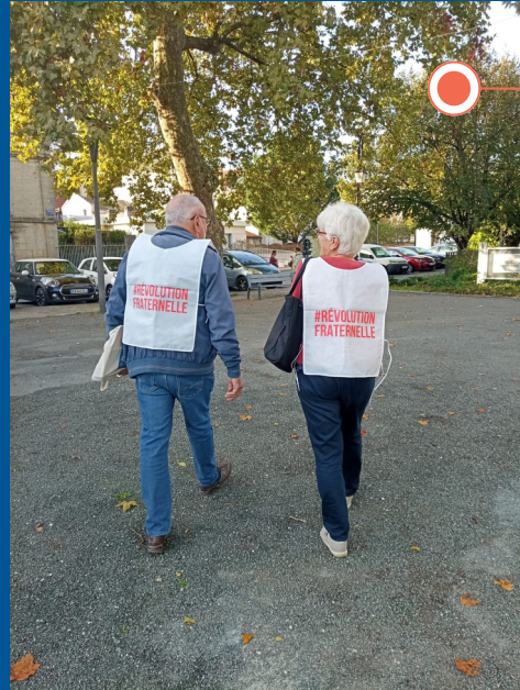
Déploiement de notre action d'écoute et de soutien auprès des personnes sinistrées de l'orage de grêle du Ribéracois.