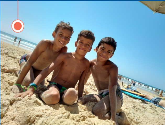
Vacances en famille à Biscarrosse, un projet accompagné par l'équipe de Casteljaloux.