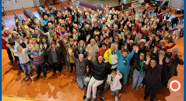
Session à Lourdes réunissant les acteurs de notre délégation dans le cadre de la promulgation de notre nouveau projet de délégation.